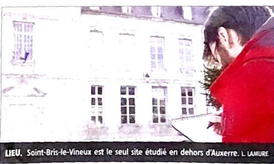
LIEU. Saint-Bris-le-Vineux est le seul site étudié en dehors d'Auxerre. L. LAMURE

Avant une présentation finale ouverte au public au cinéma CGR (samedi, à partir de 9 heures), les étudiants nancéens ont visité et analysé cinq sites entre lundi et mercredi : les places de l'Arquebuse et des Cordeliers, le quartier de l'Abbaye Saint-Ger-